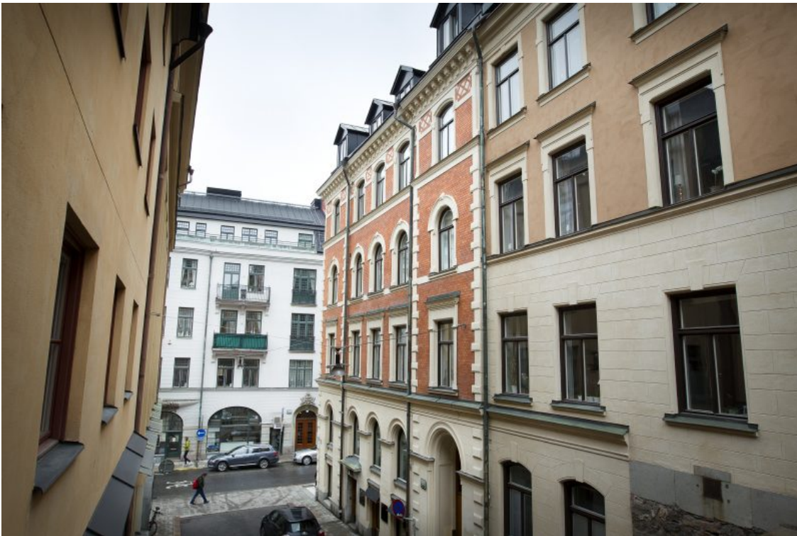
Vasastans dyraste nyproduktion ligger på Regeringsgatan.

Själv bor han i en äldre hyresrätt vid Odenplan. Att byta till en nyproducerad lägenhet ser han inte som ett alternativ.